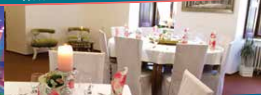
Hotel *** Zámok Topoľčianky