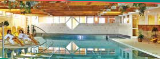
Hotel *** FLÓRA, Trenčianske Teplice