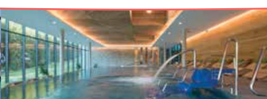
Hotel *** SOREA SNP, Demänovská dolina