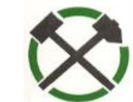
OZ PBGN SR