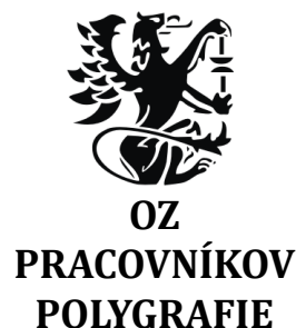
OZ PRACOVNÍKOV POLYGRAFIE